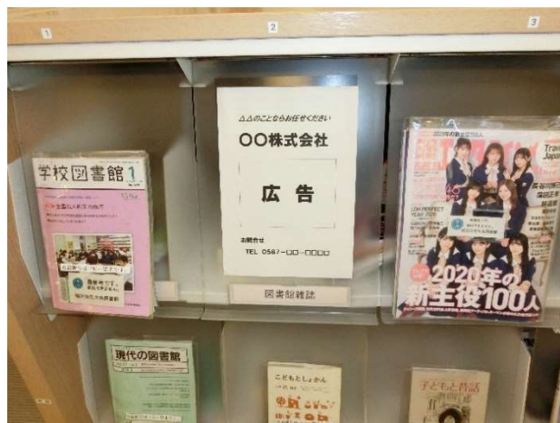
※雑誌スポンサー広告掲載イメージ【左:新号カバー表(おもて)面・裏面 右:雑誌棚】