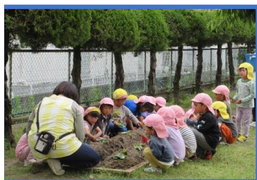
サツマイモの苗植え (自然とのかかわり)

○引き続き、地域交流の観点から大塚小学校との交流会や老人施設への慰問等、交流を通して地域との様々な繋がりを深めていく経験をしていきます。