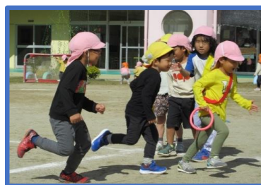
リレーあそび (健康な心と体)