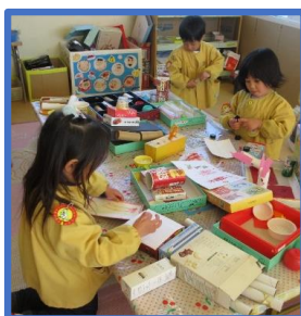
主体的な制作あそび (豊かな感性と表現)