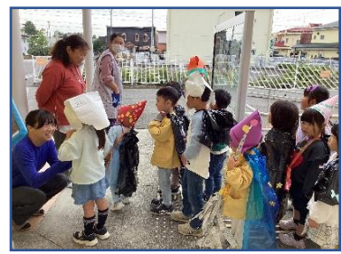
お散歩（地域とのつながり）