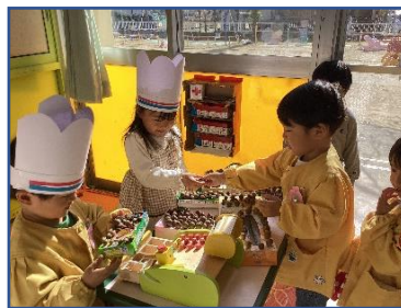
遊びの様子（主体的保育）