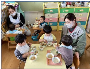
食事の様子（育児担当制保育）

・「子どもを尊重する保育」を意識し、食事や排せつの場面で担当保育士が子どもとの応答的な関わりを大切にする育児担当制や保育室の環境を整え、子ども達が自ら遊びを選び進めていく主体的な保育に取り組んできました。自己評価の結果として、2保育実践、3環境作り、4子どもへの関わりで職員の高い意識がみられました。地域との連携では、今年度はお散歩マップ作りに取り組み、散歩で見つけたものや遊んだものを写真に撮りマップに掲示した結果、子ども達にとって行き先が分かりやすい散歩コースになり、散歩をより楽しめるようになりました