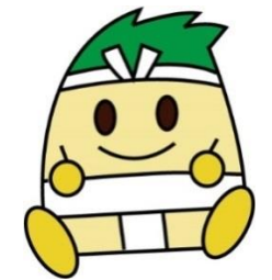
稲沢市マスコットキャラクター 「いなっピー」