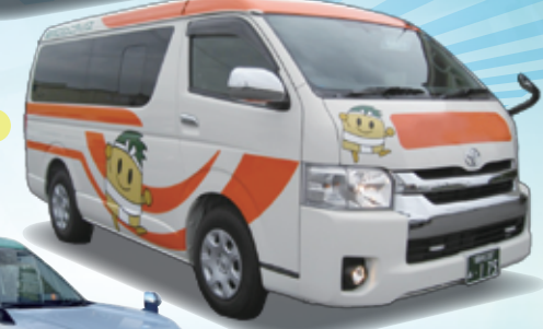
コミュニティバス