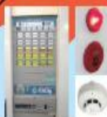
自動火災報知設備