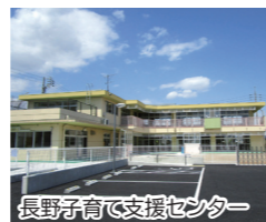
長野子育て支援センター

私立を含め、子育て支援センター5カ所、児童館・児童センター11カ所、保育園30カ所、幼稚園4カ所などさまざまな子育て施設が整っています。