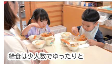
給食は少人数でゆったりと