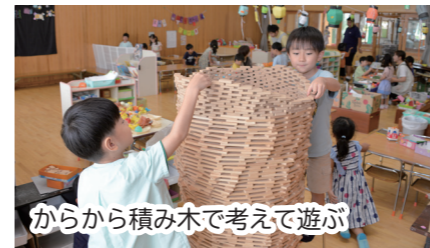
からから積み木で考えて遊ぶ

市内の公立及び私立の保育園では自分で考え自分から行動する力や非認知能力を伸ばす、子どもの主体性を大切にしたい保育を0歳児から行っています。