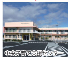
中央子育て支援センター

全ての妊産婦、子育て世帯、子どもへの一体的な相談支援を行うため、中央子育て支援センター内に「こども家庭センター」を設置しています。