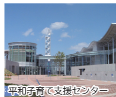
平和子育て支援センター