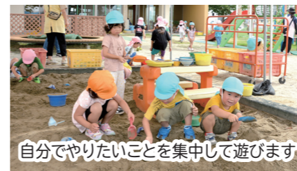
自分でやりたいことを集中して遊べます