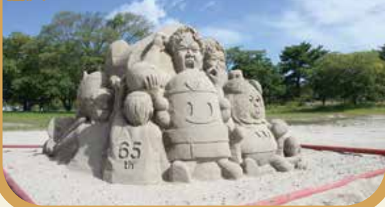
10月7日～11月3日 稲沢サンドフェスタ 2023