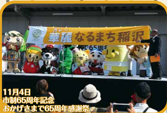
11月4日 市制65周年記念 おかげさまで65周年感謝祭