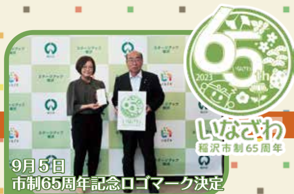
9月5日 市制65周年記念ロゴマーク決定