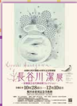
10月28日～12月10日 市制65周年 美術館開館40周年記念 特別展 長谷川 潔展 -京都国立近代美術館 コレクション-