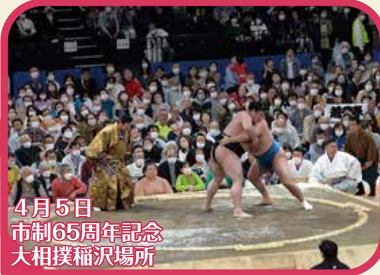
4月5日 市制65周年記念 大相撲稲沢場所