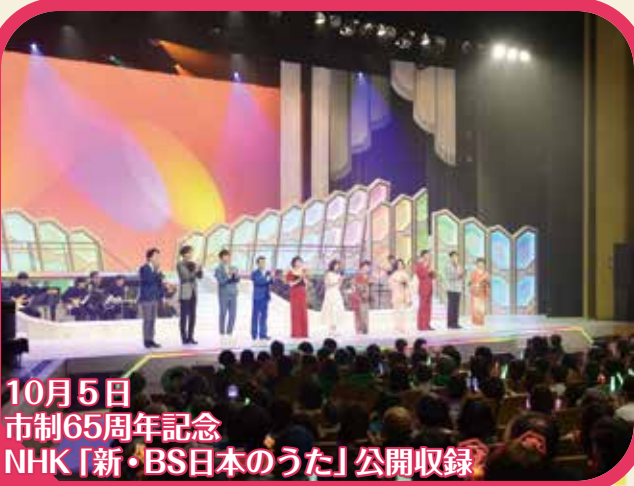
10月5日 市制65周年記念 NHK「新・BS日本のうた」公開収録