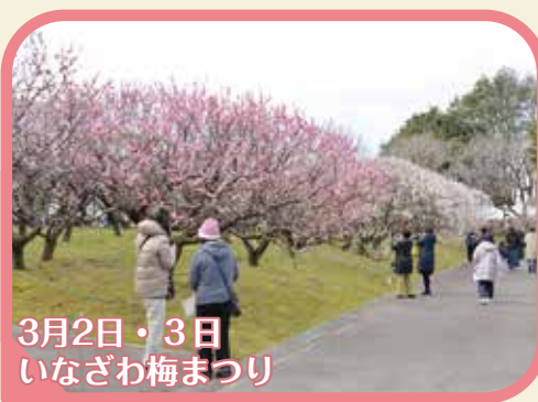
3月2日・3日 いなざわ梅まつり