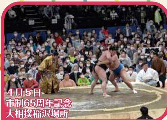
4月5日 市制65周年記念 大相撲稲沢場所