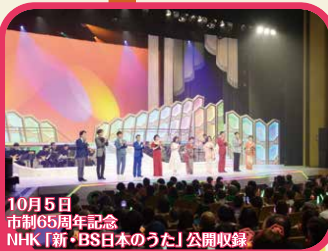
10月5日 市制65周年記念 NHK「新・BS日本のうた」公開収録