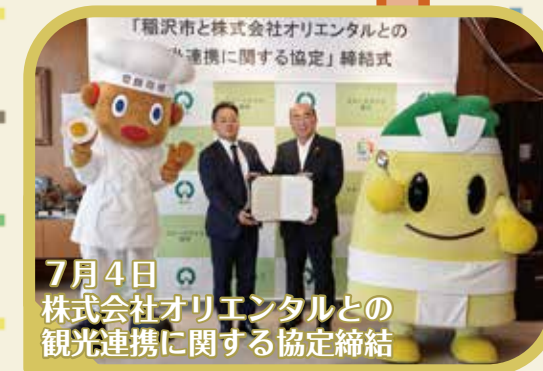
7月4日 株式会社オリエンタルとの 観光連携に関する協定締結