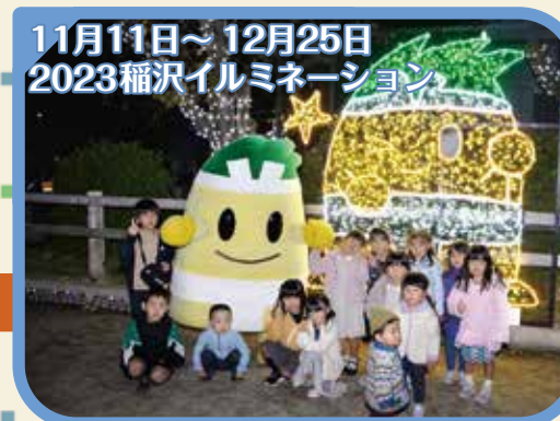
11月11日～12月25日 2023稲沢イルミネーション