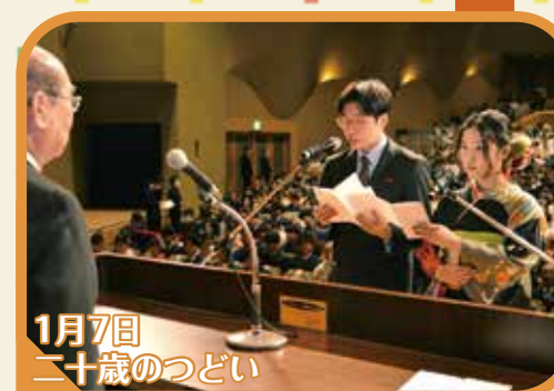
1月7日 二十歳のつどい