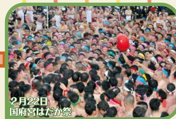
2月22日 国府宮はだか祭