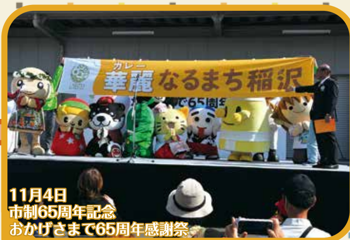
11月4日 市制65周年記念 おかげさまで65周年感謝祭