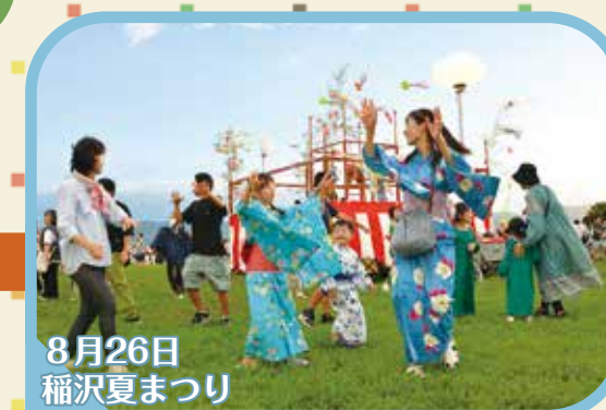
8月26日 稲沢夏まつり