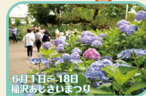
6月1日～18日 稲沢あじさいまつり

10月28日～12月10日 市制65周年 美術館開館40周年記念 特別展 長谷川潔展 -京都国立近代美術館 コレクション-