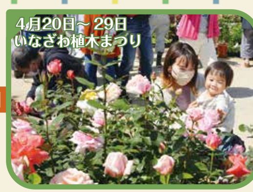
4月20日～29日 いなざわ植木まつり