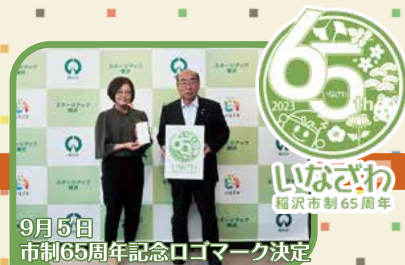
9月5日 市制65周年記念ロゴマーク決定