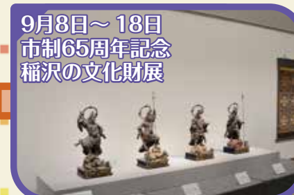
9月8日～18日 市制65周年記念 稲沢の文化財展