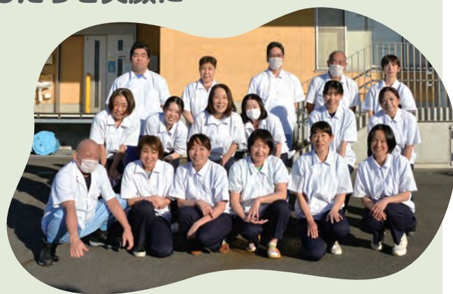
稲沢東部学校給食調理場 調理員の皆さん

子どもたちが給食を残さず食べてくれたり、「おいしかったよ」という声が聞けたりすると、やりがいを感じますし、仕事の大きな励みになります。これからも、子どもたちを笑顔にできるおいしい給食が作れるよう、がんばります!