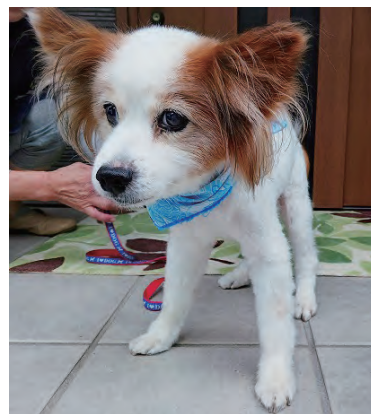
▲令和5年度市長賞(中小型犬) ピースちゃん

申 4月1日(月)～6月28日(金)に、申請書に記入の上、環境保全課へ ※用紙は市内の一部動物病院にもあります