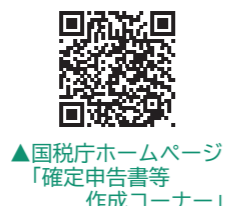
▲国税庁ホームページ「確定申告書等作成コーナー」