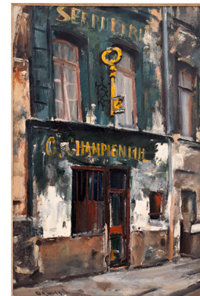
新規購入作品 《鍵屋》 1966年 油彩・カンヴァス

ともに所蔵は稲沢市荻須記念美術館