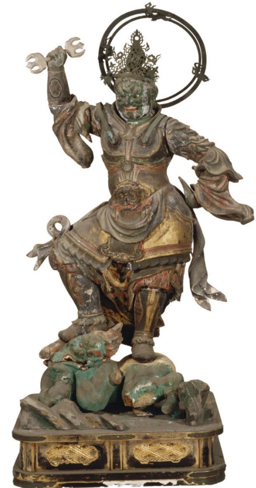
木造四天王立像のうち持国天(伝増長天)、鎌倉時代 (市指定文化財) ▶