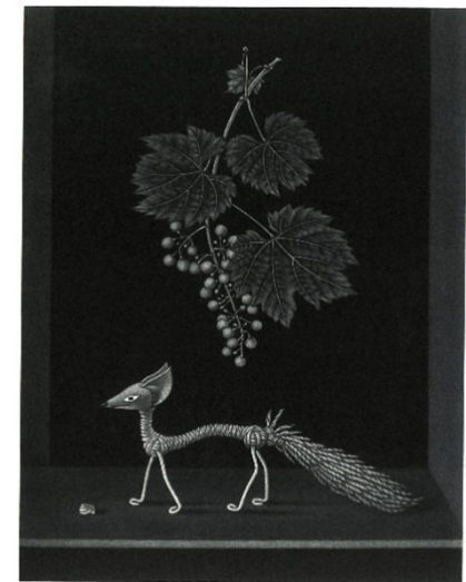
《狐と葡萄（ラ・フォンテーヌ寓話）》1963年