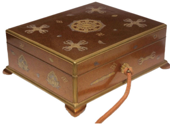
▲灌頂道具のうち蒔絵灌頂道具箱 鎌倉～江戸時代 (県指定文化財)