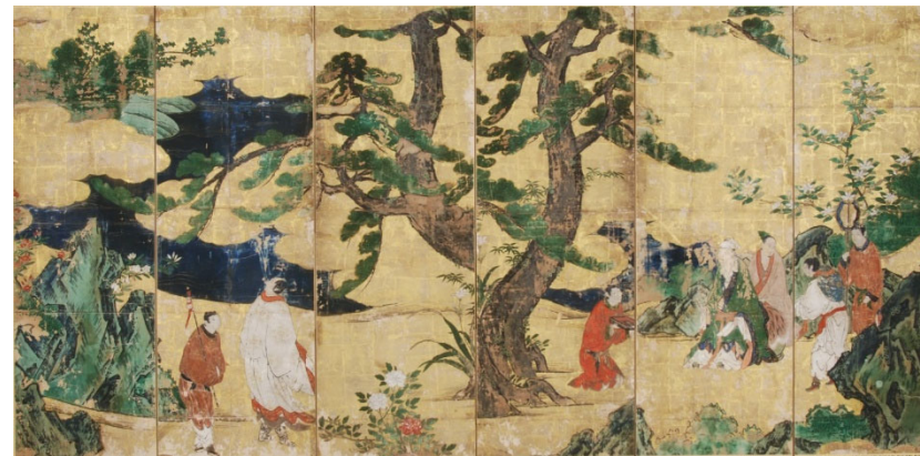
▲紙本金地著色唐人物図屏風、江戸時代 (市指定文化財)