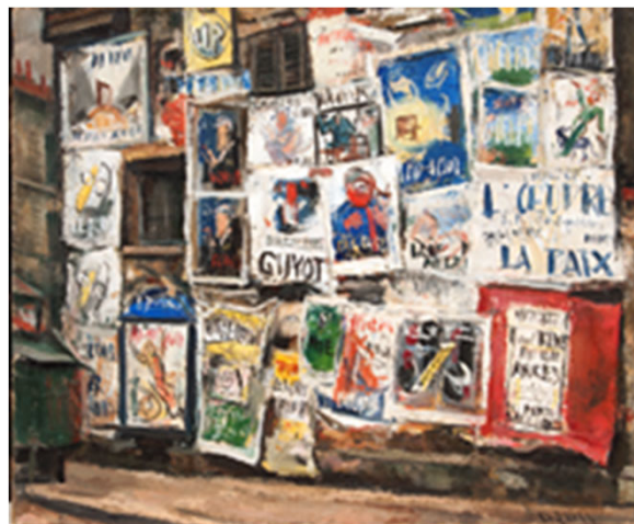
新規購入作品 《ポスターの壁》 1930年 油彩・カンヴァス