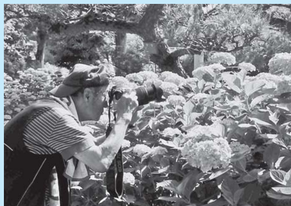
▲写真コンテストも開催され、会場には朝早くから熱心にアジサイの撮影をする方々の姿がありました