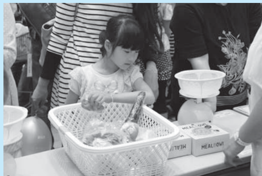
◀ドキドキ！一日に必要な野菜350gを当てられるかな