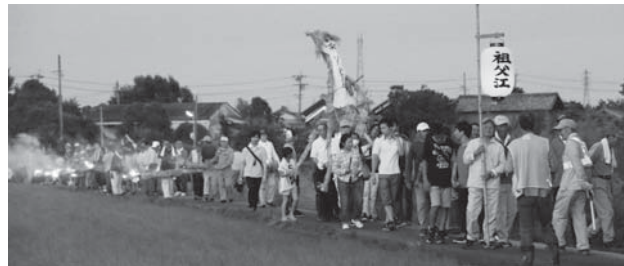
▲尾張の虫送り(祖父江の虫送り)

土曜日(外科・内科)：午後1時～7時30分 日曜日、祝・休日(外科)：午前9時～午後7時30分