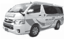
▲コミュニティバス(ワゴンタイプ)

●タクシー料金の割引 ▼対象 身体障害者手帳または療育手帳などを持っている方 ▼割引率 1割 ▼利用方法 タクシーを利用したときに手帳を提示