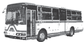
▲コミュニティバス(中型バス)

身体障害者手帳・療育手帳の旅客鉄道株式会社運賃減額欄が第1種の方は、手帳を提示すると本人と介護者1人が5割引、第2種の方は本人のみ5割引になります。 精神障害者保健福祉手帳の障害等級が1・2級の方は、手帳を提示すると本人と介護者1人が5割引、3級の方は本人のみ5割引になります。