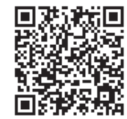
市公式ホームページ