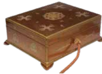
▲灌頂道具のうち蒔絵灌頂道具箱(鎌倉～江戸時代)

鎌倉時代に制作された岩倉流の法具と江戸時代に制作された地藏院流の法具が箱に納められている、全国的にも珍しいものです。9月8日(金)～18日(祝)に荻須記念美術館で開催される稲沢の文化財展にも展示されます。