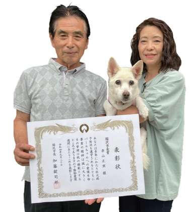
▲令和4年度市長賞 パールちゃんご家族

表彰基準 4月1日現在で次の全てを満たしていること ①同じ犬を15年以上（平成20年3月31日以前から）飼育し、犬の登録と毎年 こっしょう の狂犬病予防注射を実施している ②これまで一度も咬傷事故などを起こしていない ③過去に同一犬でこの表彰を受けていない 申 4月3日（月）～6月30日（金）に、申請書に記入の上、環境保全課へ（用紙は市内の一部動物病院にもあります）