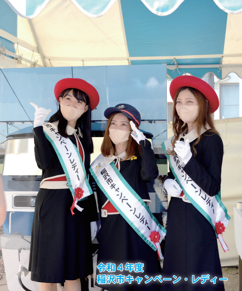
令和4年度 稲沢市キャンペーン・レディー