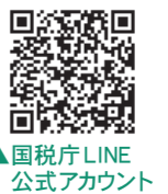
▲国税庁LINE公式アカウント