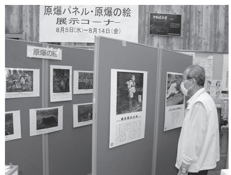
原爆パネル・原爆の絵 展示コーナー 8月5日(木)～8月14日(金) 原爆の絵の展示 (市役所・中央図書館のみ) の設置、広島市の高校生が被爆体験証言者と共同制作した原爆の絵の展示 (市役所・中央図書館のみ)

原爆パネル展 市役所総務課 ☎0587(32)1152 ID 10002841 ▼とき 8月5日(木)～15日(日) ▼ところ 市役所市民ホール、支所、市民センター、中央図書館 ▼内容 原爆による被害写真などのパネル展示、折り鶴コーナーや感想ノート 最終戦から76年を迎え、戦争の悲惨さや平和の尊さ大切さを伝えていくために開催します。