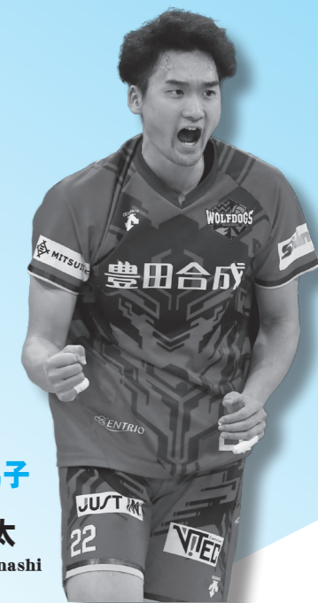
バレーボール男子