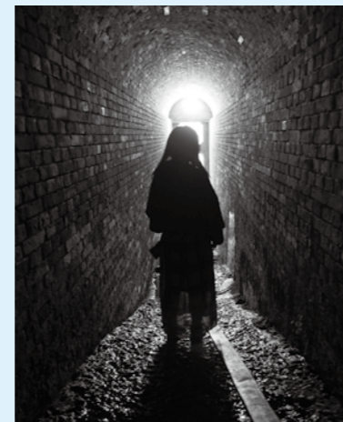
▲令和2年度市民展 県教育委員会賞 写真《明日を信じて》 田中伸明

の上、狭須記念美術館へ(用紙は申込先にあります。当日記入も可)▼その他 入賞・入選作品を市民展(日本画・洋画・写真)10月5日(火)~10