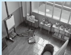
▲アトリエ復元施設

荻須高徳の美術学校時代から晩年までの作品を、油彩画を中心に展示。パリのアトリエを復元した施設では、荻須が作品を制作した当時の雰囲気を感じられます。