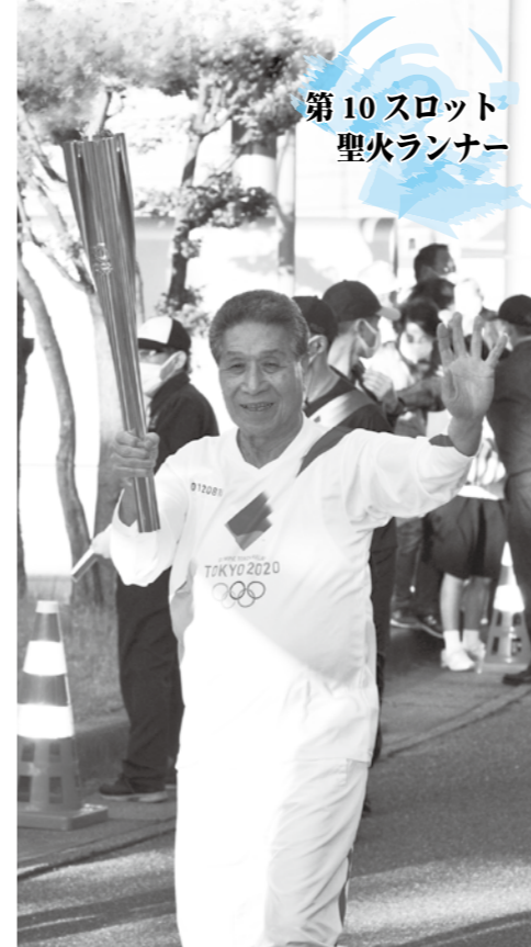
第10スロット 聖火ランナー