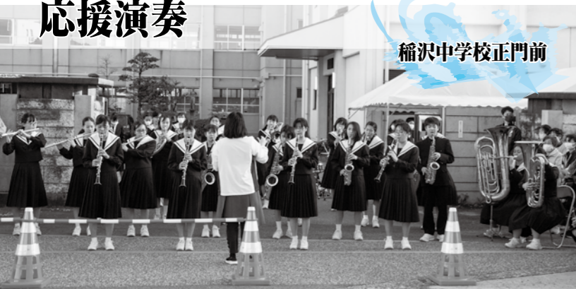
稲沢中学校正門前