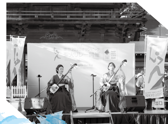
出発地 ミニセレブレーション