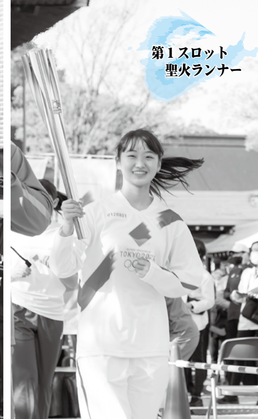
第1スロット 聖火ランナー