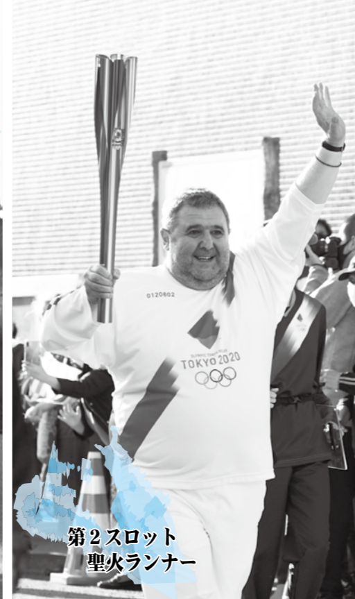
第2スロット 聖火ランナー