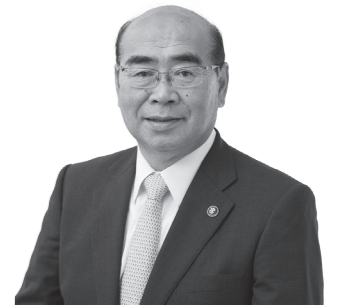
稲沢市長 加藤錠司郎

名鉄国府宮駅周辺再整備の事業推進とともに新たな住居系市街地の形成、東西幹線道路の整備促進に向け協議・調整を行ってまいります。地域経済の活性化に向け、新型コロナウイルス感染症の影響を受けた事業者への支援や、「稲沢まちゼミ」事業についても引き続き補助を実施し、参加店舗や講座の拡充に取り組んでまいります。また、新たな観光資源として「祖父江ぎんなんパーク」が 6 月にオープンするほか、荻須高徳画伯の生誕 120 年を記念した特別展を開催するなど、積極的に本市の PR を行なってまいります。