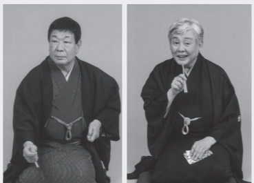
▲柳家さん喬 ▲柳家喬太郎

▶とき 6月20日(日)、午後2時 ▶ところ 大ホール ▶出演 柳家さん喬、柳家喬太郎、柳家やなぎ ▶費用 S席4,500円、A席3,500円 ▶販売場所 名古屋文理大学文化フォーラム(市民会館)、チケットぴあ、ローソンチケット、名鉄ホールチケットセンター ※未就学児の入場は同伴の場合でも控えてください