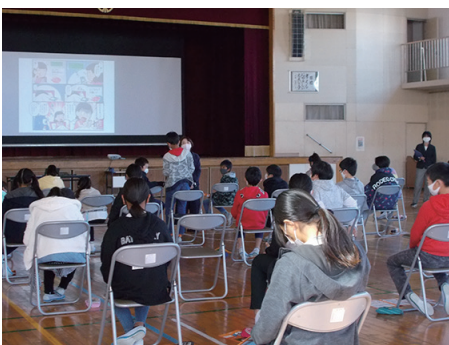
▲スマホ安全教室の様子

使用に関しての家庭でのルールや保護者の管理をおろそかにすると、ネットでのトラブルやいじめなどの問題に発展する可能性があります。子どもたちをネット上で被害者・加害者にさせないために、また、スマホ依存症などから守るためにも、インターネットへの危機意識をしっかりと高めておく必要があります。