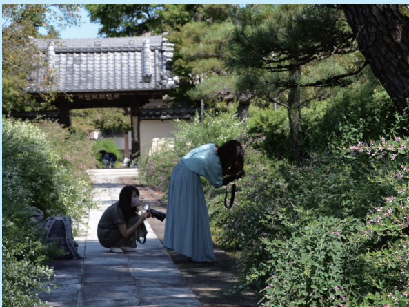
▲カメラを持って境内散策。季節を楽しむひとときは心が癒されますね