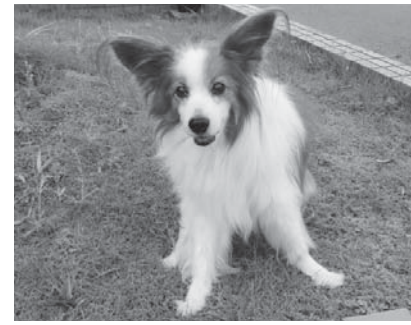
▲平成30年度市長賞 パピークン

▼表彰基準 4月1日現在で次の全てを満たしていること ①同じ犬を15年以上飼育し、犬の登録と毎年狂犬病予防注射を実施している②これまで一度も咬傷事故などを起こしていない③過去に同一犬でこの表彰を受けていない▼申し込み 4月1日(月)～6月28日(金)に、申請書に記入の上、環境保全課へ(用紙は申請先や市内の一部動物病院にあります。市のホームページにも掲載します)▼その他 申請