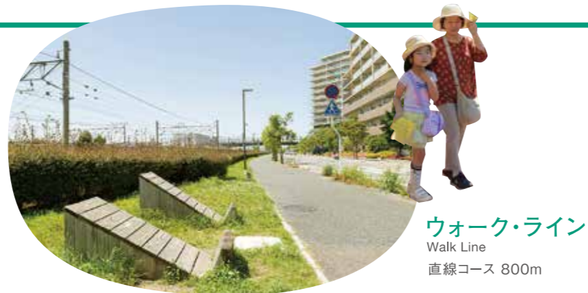
ウォーク・ライン Walk Line 直線コース 800m

稲沢フィットネスロードには、3つのコースがあります。ウォーミングアップからクールダウンまで、特長のあるエリアのウォーク・ライン、長距離コースのロング・ライン、短い距離のショート・ライン。自分にあったコースが選べます。