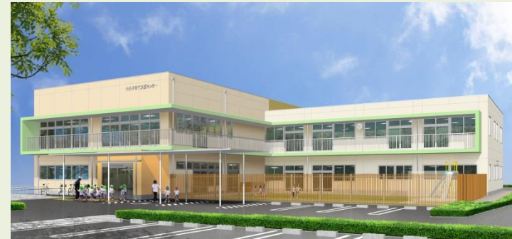
〔中央子育て支援センター 建設予定図〕