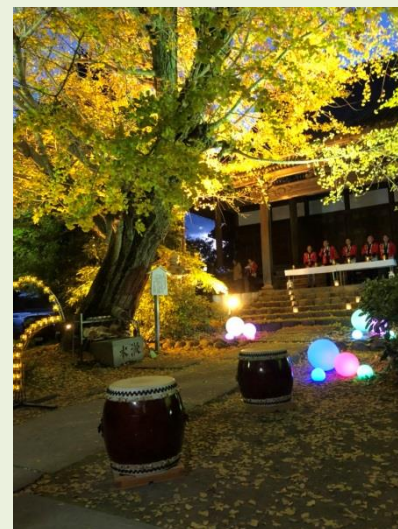
(イチョウ黄葉まつり)