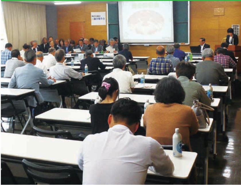
昨年度の議会報告会

議会報告会につきましましては、議会活動の広報、市民の皆様のご意見をお聞きする大切な機会であると考えており、例年5月に実施してまいりました。 今回につきましましては、新型コロナウイルス感染拡大予防対策の観点からやむを得ず、中止の判断をさせていただきました。 3ページから5ページの各常任委員会における令和2年度新規（拡充）事業並びに新型コロナウイルス感染症対策による補正予算の報告をもって、議会報告会に代えさせていただきます。 ご理解賜りますようお願い申し上げます。