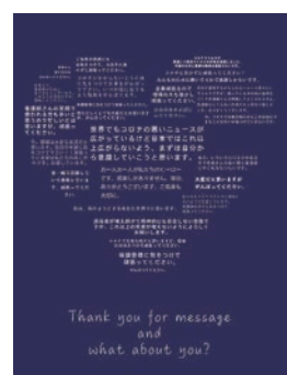
病院職員へのメッセージ

当面は、社会経済活動を持続させながらウイルスと共存していかなければならない。今回の出来事が我々に与えられた試練であったとしても、人類の歴史の中でも幾度かあったウイルスとの戦いの一つである。英知を結集すれば必ず乗り越えることはできるはず。戦いの先頭に立つ市長としての決意を新たにし、市民生活を守る施策、コロナ終息後を見据えた経済活動に力を入れていきたい。