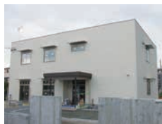
稲沢東第2児童クラブ

小学校の通学区域再編により、稲沢東小学校の児童数が増加したため、校区内に2か所目の児童クラブを整備する。