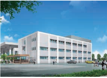
新分庁舎(東庁舎)イメージ図

※工事中は市民の皆様にもご迷惑をおかけしますが、ご理解賜りますようお願い申し上げます