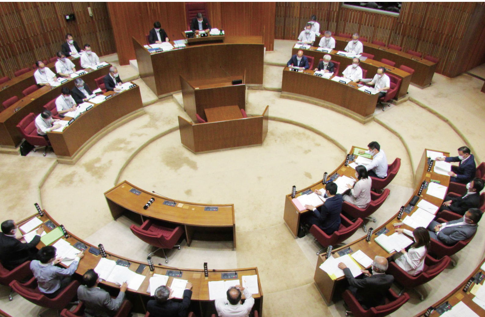
6月定例会、最終日の議場