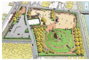
(仮称)イチョウ見本園 完成イメージ