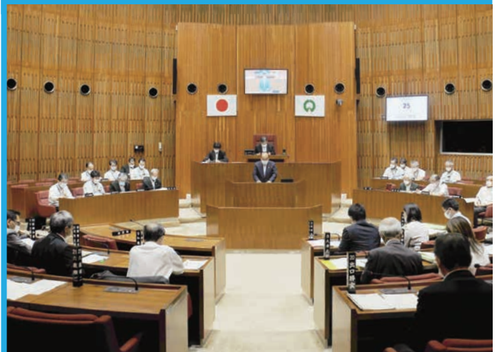
新型コロナウイルス感染拡大予防 対策を行った6月定例会

6月定例会の運営について、議会運営委員会にて協議を行い、新型コロナウイルス感染拡大予防対策を行いました。 主な対策については次のとおりです。 ①議場の扉は、開放した状態にする。 ②45分を目途に休憩をとり、換気を行う。 ③議場への入場時には、マスク着用・手指アルコール消毒・手洗いをを行う。 ④傍聴者の席の間隔を空ける。 ⑤質疑・一般質問の際、議員は、約半数ずつ、議場と別の会議室に分散する。 今後も状況に応じて、新型コロナウイルス感染拡大予防対策を講じて議会運営を行ってまいります。