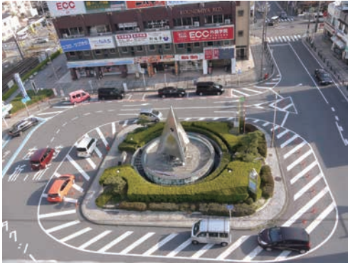
国府宮駅周辺の様子

有識・関係団体等で組織する「検討会」や、まちづくりに意欲のある市民で構成された「まちづくりを考える会」からの意見や要望、各種調査結果を踏まえ、過年度に策定した「国府宮駅周辺まちづくり基本計画」における長期ビジョンの具 体化に向けた検討を行う。