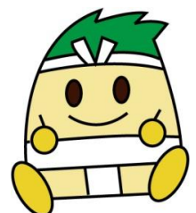
◎稲沢市 いなっぴー