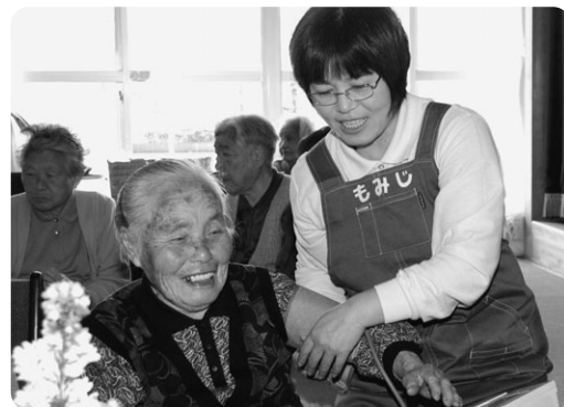
デイサービス事業

65歳以上の自立高齢者等を対象に、老人福祉施設へ送迎し、健康チェックや日常動作訓練、入浴などを行い一日養護するデイサービス事業を新市全域で実施します。なお、手数料として1回あたり380円(昼食は実費)を負担いただく予定です。