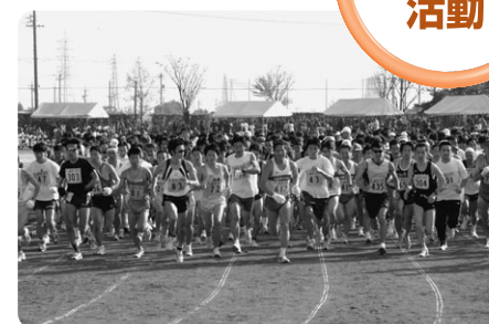
稲沢シティーマラソン