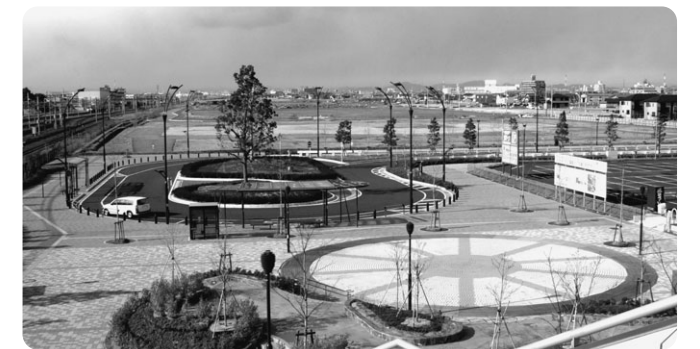
尾張西部都市拠点内稲沢駅東口駅前広場(稲沢市)