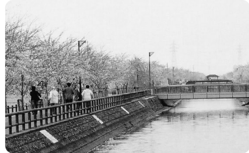
須ヶ谷川桜づつみ(平和町)