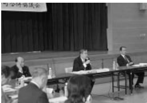
合併協議会の模様（平和町役場）