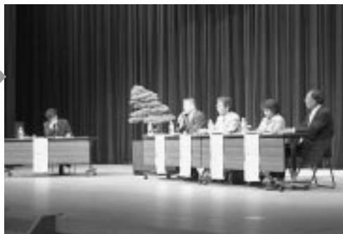
合併シンポジウム（稲沢市民会館）