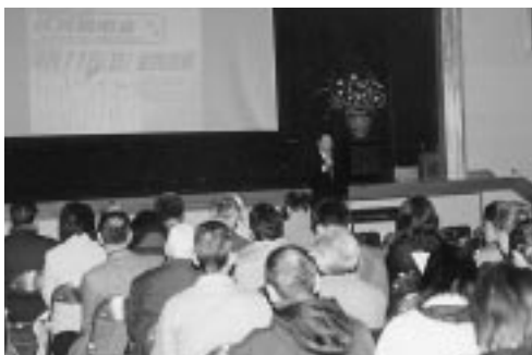
49 会場で合併住民説明会（丸甲小会場）