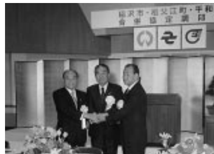
合併協定調印式（稲沢市勤労福祉会館）