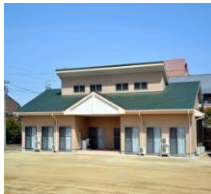
グループホームいぼりの里