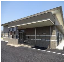
フレンドいぼりの里