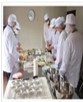
手作りパン製造の写真