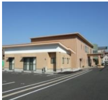
いぼりの里 (2F) ワークいぼりの里 (1F)