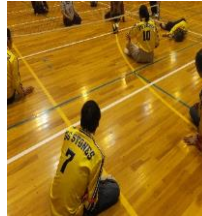
ゴロバレー大会風景