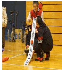
ボッチャ大会風景