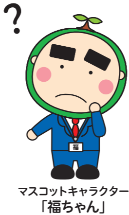
マスコットキャラクター 「福ちゃん」

この事業は『地域の縁を育む』ことを目的としています。 高齢者だけではなく、子どもも障がい者も全ての人々が 住みよい地域と生きがいを共に創り、共に高め合うことができる 『地域共生社会の実現』を目指します。