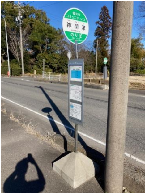
上り(稲沢市民病院行き)