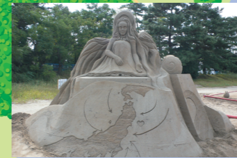
毎年、秋に「サンドフェスタ」が開催されます。

野外卓を配した芝生広場や林の中で、家族バーベキューなどが楽しめる、みんなの広場です。