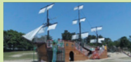
■アスレチックが楽しめる木製帆船「アドベンチャー号」