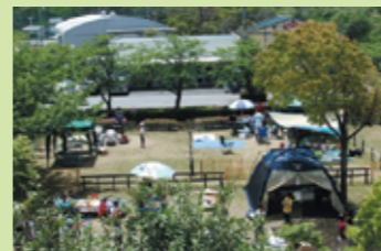
■バーベキュー広場

木製帆船「アドベンチャー号」で探検気分。 全長70mのローラー滑り台や、夏にはスライダーがあるプールが子供達に大人気。