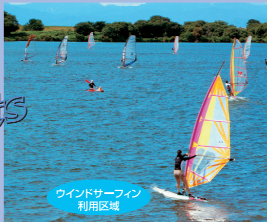
ウインドサーフィン 利用区域