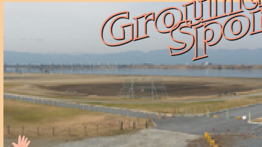
■野球場(軟式)/2面 ソフトボール場/3面