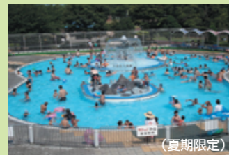
■スライダーやこども専用のあるプール (夏期限定)