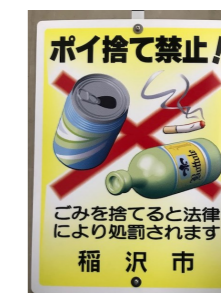
【ポイ捨て禁止の 啓発看板】