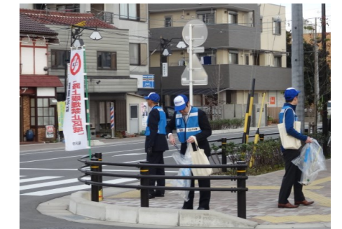
【さわやか隊】 統一行動日の環境ボラ ンティアの活動