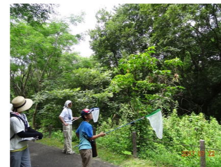
【自然観察会】 サリオパーク祖父江