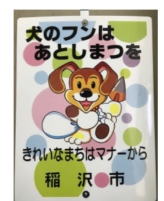
【ペットのフンの 始末啓発看板】