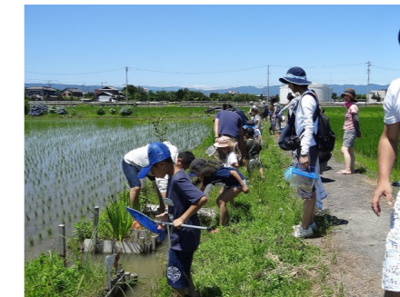
【自然観察会】 NPO法人祖父江のホタルを 守る会実験田での田んぼの 中の生きもの探し