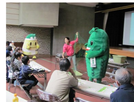
【緑のカーテン教室】