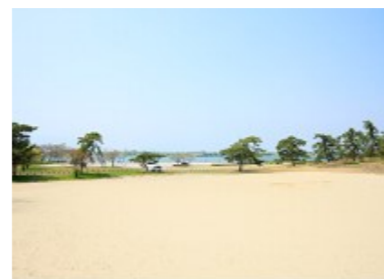
【祖父江砂丘】 日本に残る数少ない河畔砂丘