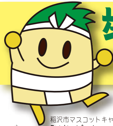
稲沢市マスコットキャラクター「いなッピー」