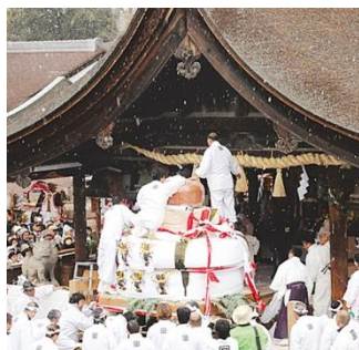
■ 国府宮はだか祭 ■