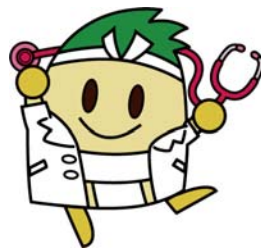
ドクターいなッピー