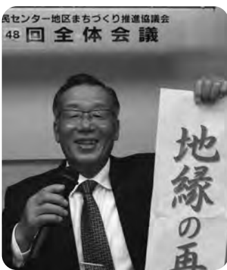
市民センター地区まちづくり推進協議会 48回全体会議