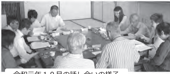
令和元年10月の話し合いの様子

少子高齢化が進み、さらにコロナ禍で人々のつながりが薄れつつある昨今。小正市民センター地区の皆さんが支え合うことのできる地域となることを願って、「小正ネットワー