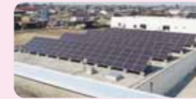
石橋浄水場3・4号配水池上部 (平成26年度設置)

・石橋浄水場の2つの太陽光発電設備を合わせて、約900㎡の地下水をくみ上げることでできる電力を発電します。 ・災害時には、1人1日3リットルの飲み水が必要とされており、この発電により10万人に対して3日間分の水量を確保できます。