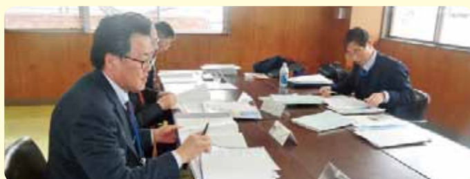
文書や記録管理についての審査