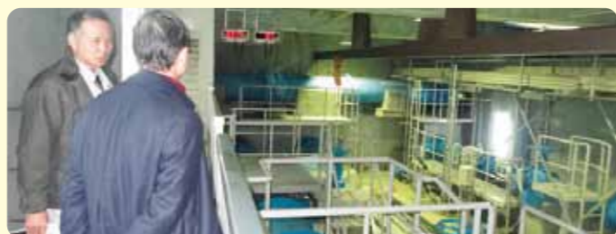
浄配水場施設の確認審査