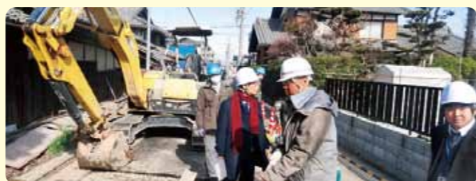
水道工事現場の確認審査

1月の審査後、審査員の報告書をもとに審査機関において約1ヶ月間の慎重審議が行われ、合否の判定を受けることとなります。また、審査の過程で6件の改善点について指摘をいただきました。