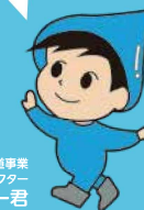
稲沢市水道事業 マスコットキャラクター ドリッピー君

写真は、被災地の給水ポイントの1つである珠洲市生涯学習センターの仮設水槽への補給を行っている様子です。