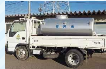
車載用給水タンク

いずれの場合も、水を受け取るためのポリタンクなどを各自で用意してください。稲沢市でも飲料水袋を備蓄していますが、数に限りがあります。