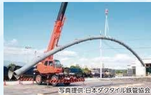
耐震型ダクタイル鋳鉄管

管と管の接続部分を地面の揺れに応じて動くようにすることで、管の抜けを防ぎます。耐震性のある水道管は東日本大震災などの災害でも被害はありませんでした。