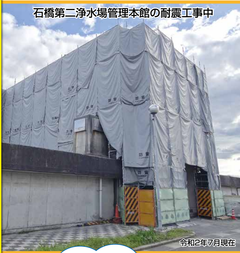
石橋第二浄水場管理本館の耐震工事中