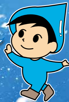
稲沢市水道事業マスコットキャラクター ドリッピー君

市では東日本大震災のような最大震度7程度の地震時でも水を使えるよう重要な管路(基幹管路)・石橋浄水場の耐震化、応急給水栓の設置を継続して行っているよ。ご家庭でも災害に備えて、水の備蓄をしよう。