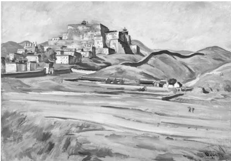
《熱河喇嘛廟》 1941年 油彩・カンヴァス

全て荻須高徳作、稲沢市荻須記念美術館所蔵 © ADAGP, Paris & JASPAR, Tokyo, 2017 G1020