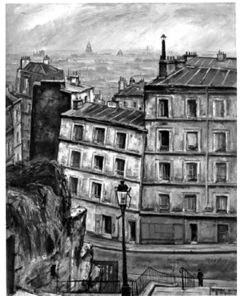
《パリの屋根、人と街灯》 1950年 油彩・カンヴァス

全て荻須高徳作、稲沢市荻須記念美術館所蔵 © ADAGP, Paris & JASPAR, Tokyo, 2017 G1020