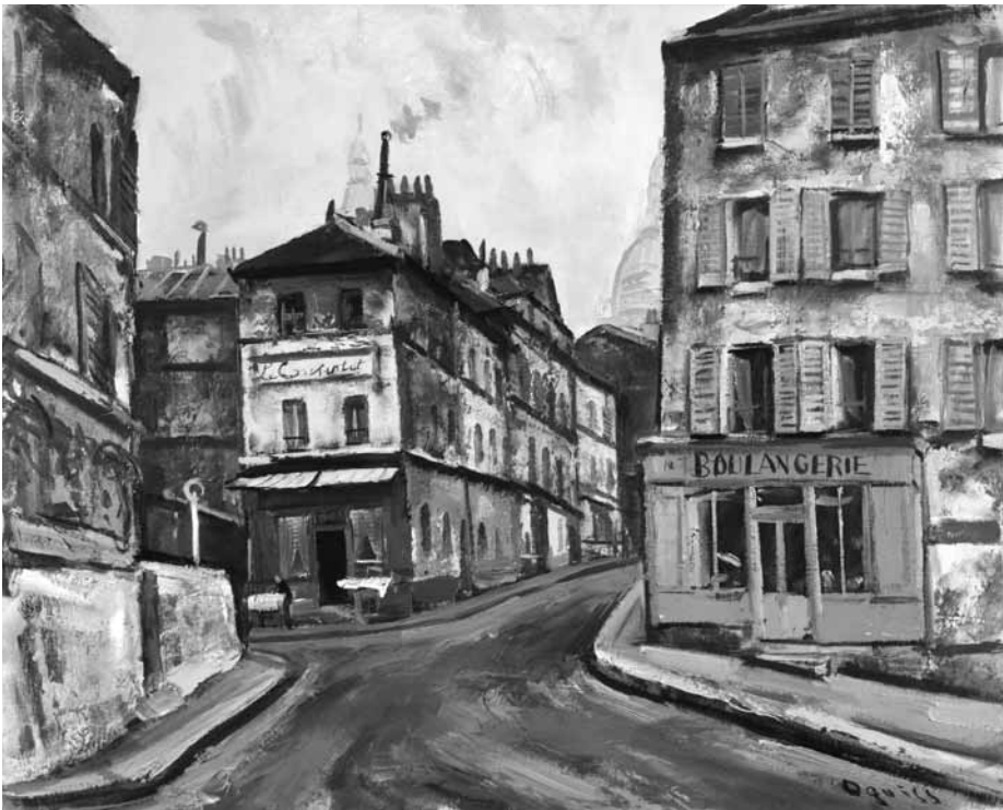
《モンマルトル》 1935年 油彩・カンヴァス