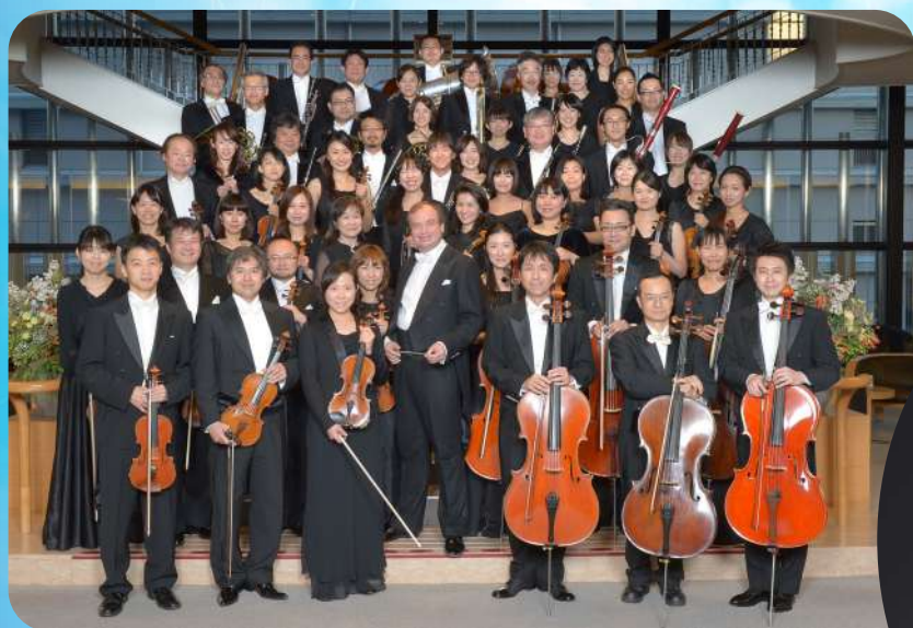
管弦楽 / セントラル愛知交響楽団

ロベルト・シューマン:ピアノ協奏曲イ短調 Op.54 ブラームス:交響曲第1番ハ短調 Op.68