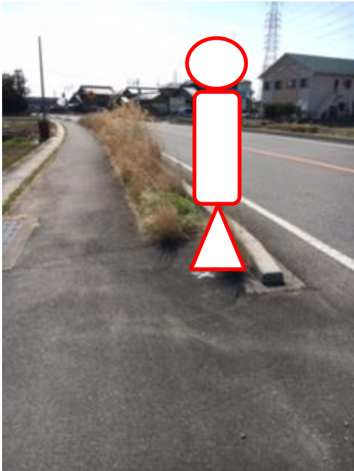
下り(平和支所行き)