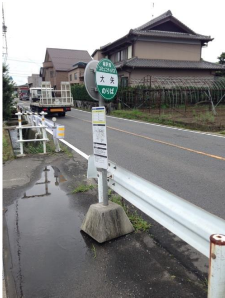
上り（稲沢市民病院行き）