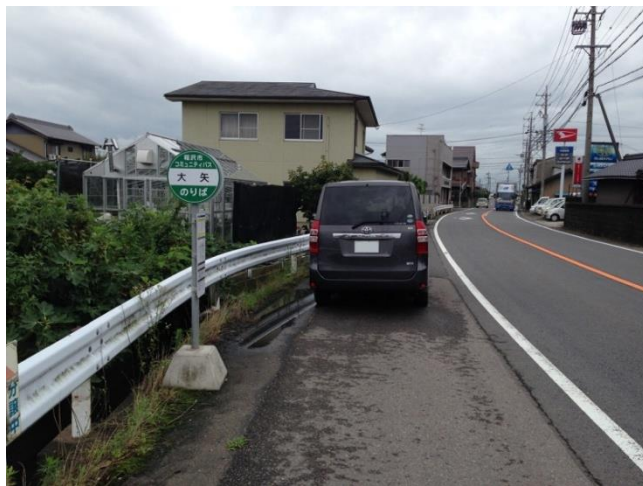
下り（平和支所行き）