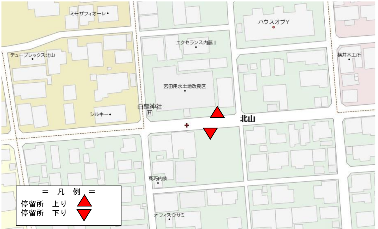
宮田用水土地改良区前